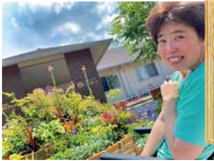
満開スマイル 社長賞

約2か月間の募集期間にたくさんの作品が本部に届きましたが、好きなお花をピックアップして撮る人、ガーデンを背景に利用者様にモデルになっていただく人...と、本当に様々。今回はそんな作品の中から見事「賞」に選ばれた作品を皆様にもご紹介いたします。