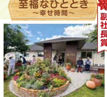
至福なひととき ～幸せ時間～ 副社長賞

至福ガーデンに集う利用者の皆様の温かい雰囲気があふれて、ほっこり気分になる1枚です。