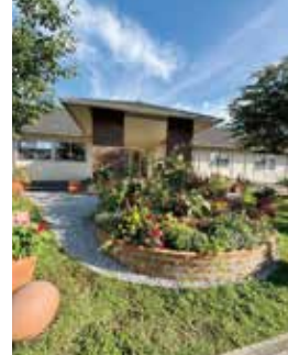
梅雨の晴れ間 副社長賞