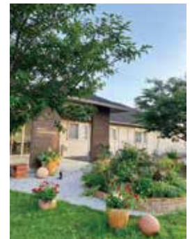
ベストショット賞

メインの花壇と建物、前後の桜の木の緑がバランス良く配置された構図が素晴らしい1枚です