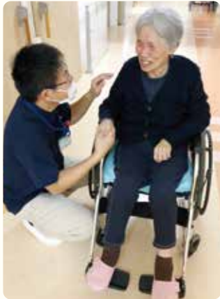
男性職員にもご注目くださいね。

当事業所には複数の男性職員が在籍しています。男性職員ならではの力強さと、ときには女性以上の優しさと笑顔をもっと、日々利用者様のお世話をさせて頂いています。女性スタッフとはまた異なった視点からケアの提供ができるのも男性職員ならではの。利用者はもとより、ご家族様からもご好評をいただいています。